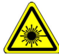
24.12 Warnung vor Laserstrahlen