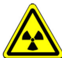
24.14 Warnung vor radioaktiven Stoffen oder ionisierende Strahlen