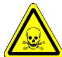
24.08 Warnung vor giftigen Stoffen