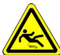
24.15 Warnung vor Rutschgefahr