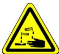
24.01 Warnung vor ätzenden Stoffen