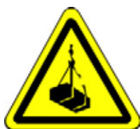
24.13 Warnung vor schwebender Last