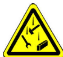
24.06 Warnung vor herabfallenden Gegenständen