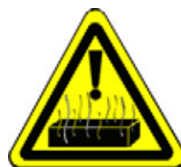
24.11 Warnung vor heißen Stoffen