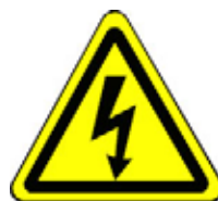
24.03 Warnung vor gefährlicher elektr. Spannung