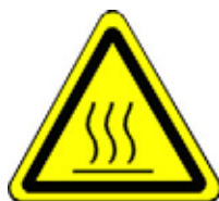
24.10 Warnung vor heißen Oberflächen