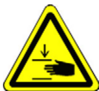
24.09 Warnung vor Handverletzungsgefahr