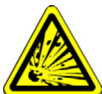
24.05 Warnung vor explosionsgefährlichen Stoffen