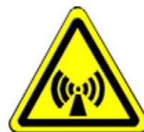
24.04 Warnung vor elektromagn. Feldern