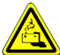
24.02 Warnung vor Gefahr durch Batterien