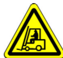
24.16 Warnung vor Flurförderzeugen