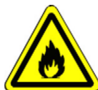
24.07 Warnung vor feuergefährlichen Stoffen