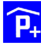
4.25.1 Parkhaus mit Anschluss an öffentliches Verkehrsmittel