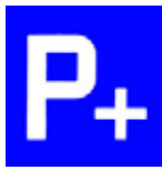
4.25 Parkplatz mit Anschluss an öffentliches Verkehrsmittel